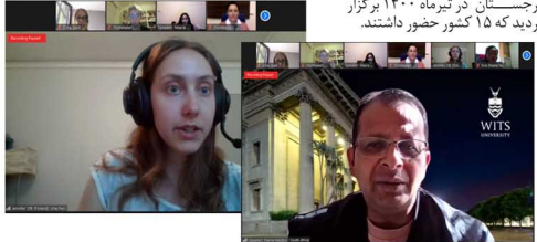
Online ICWIP 2021 Melbourne University